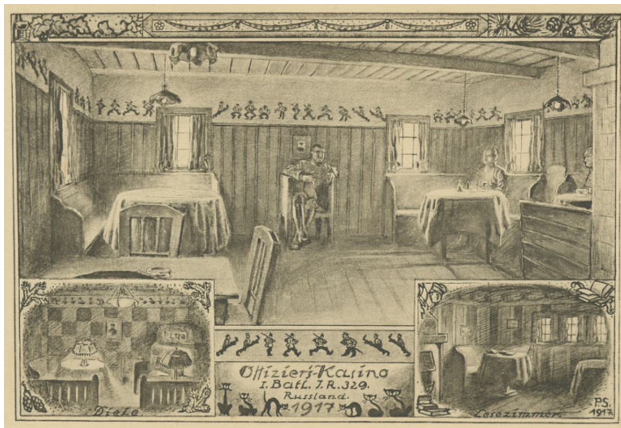
Offiziers-Kasino, Inv.-Nr. 2017.148.011

aufgrund ihrer individuellen Architektur kaum mehr provisorisch wirkenden Behausungen fort.