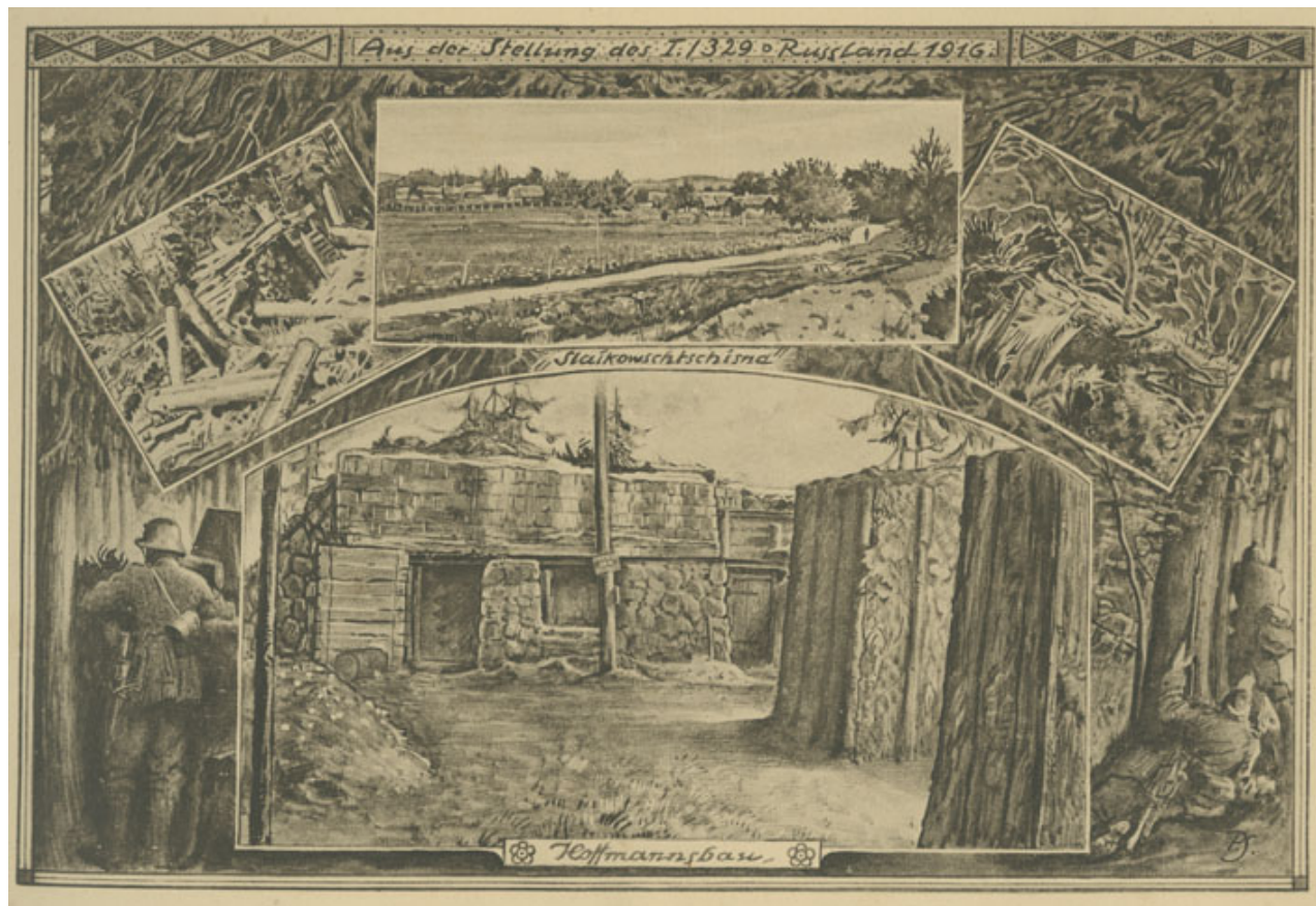
Aus der Stellung des I. Bataillons des Infanterie-Regiments 329, Rußland 1916, Inv.-Nr. 2017.148.002

Häufig arrangierte der Zeichner verschiedene Ansichten – gleich einem Photo-Album – zu einer Komposition. Viele Bilder tragen vergleichbare informative Aufschriften.