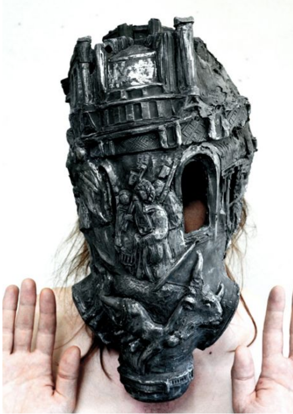
Der unendliche Kreis